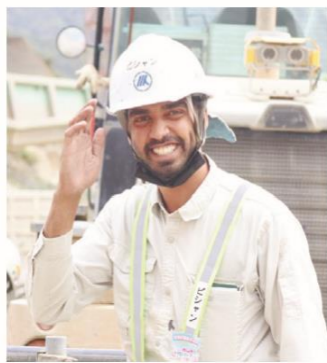
→建設作業に従事するスリランカ人