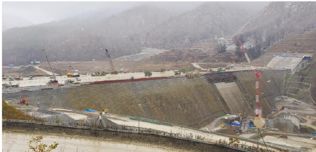
→建設中の成瀬ダム (秋田県東成瀬村)

現在、そのレトルトカレーが商品化され、販売されています。次第に人気を博し始めていると聞きました。私も頂きました。17種類のスパイスが効いた本格的なカレーです。ダム工事にご縁で生まれた「ダムカレー」、ぜひ皆さんもご賞味ください。